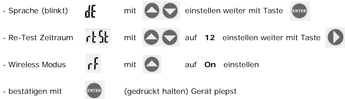
Bild: Setup Grundeinstellung PAT-2E und PAT-10

Die Grundeinstellungen werden angezeigt: